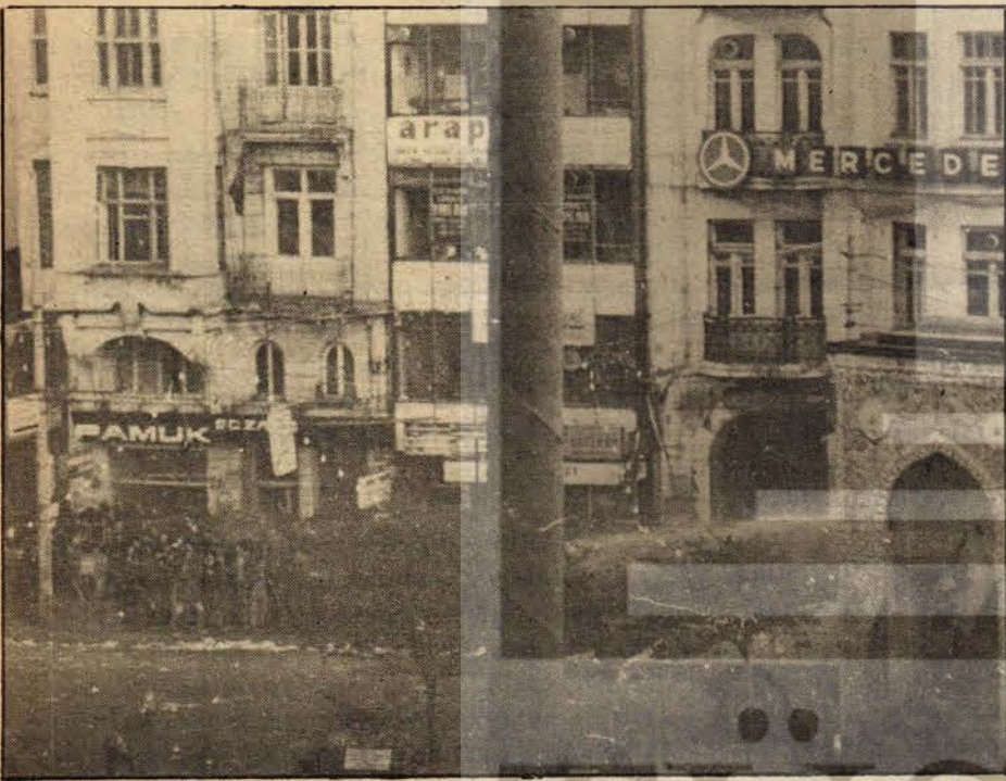
5 Aynı panzer su sıkmaya devam ediyor. Panzerden korunmaya çalışan halk Pamuk Eczanesi ve Kazancı Yokuşu'na doğru sıkışıyor.