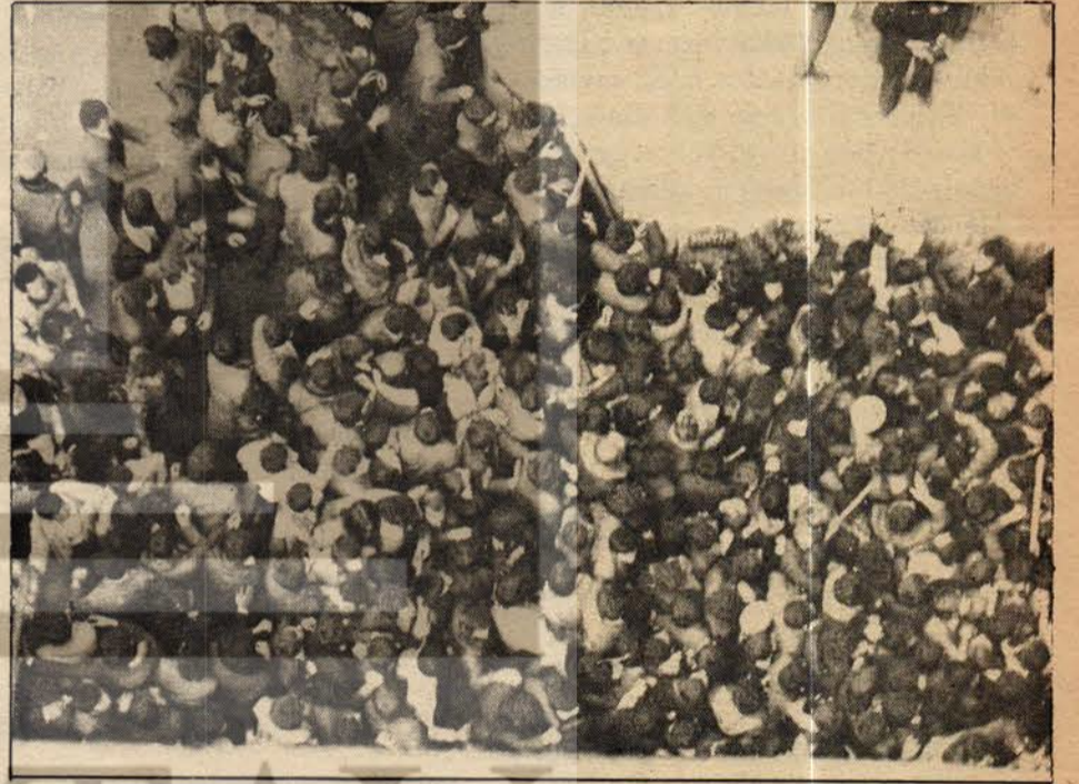
8 Kazancı Yokuşu başının yukardan çekilmiş fotoğrafı. Halk korunmaya çalışıyor. Sıkışıklık i-vice artmış vaziyette.