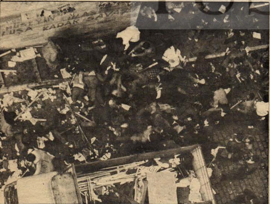
11 Kazancı Yokuşu. Kamyonetin diğer tarafı. Şe - hitlerin büyük çoğunluğu burada.