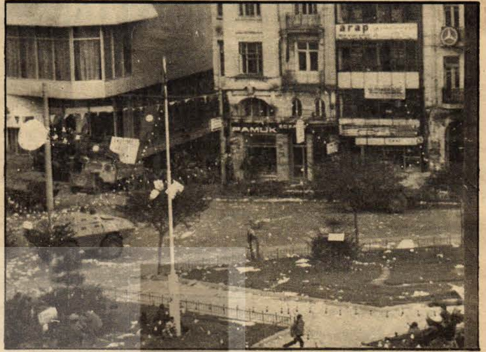
2 Halk Kazancı Yokuşu'na doğru koşuyor.