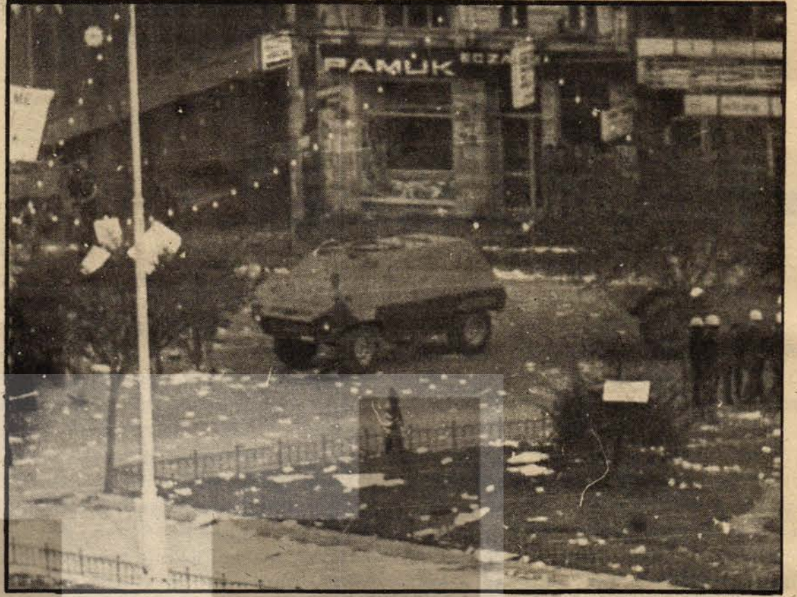
Panzer kadın şehidi eziyor.

Revizyonistler, Taksim alanında bütün halkın, bütün işçilerin çeşitli kitle örgütlerinin ve sendikaların bir araya gelmesini kendileri açısından sakıncalı buldular. Böyle bir durumun kendi hakimiyetlerini sarsacağını düşündükleri için Taksim alanına