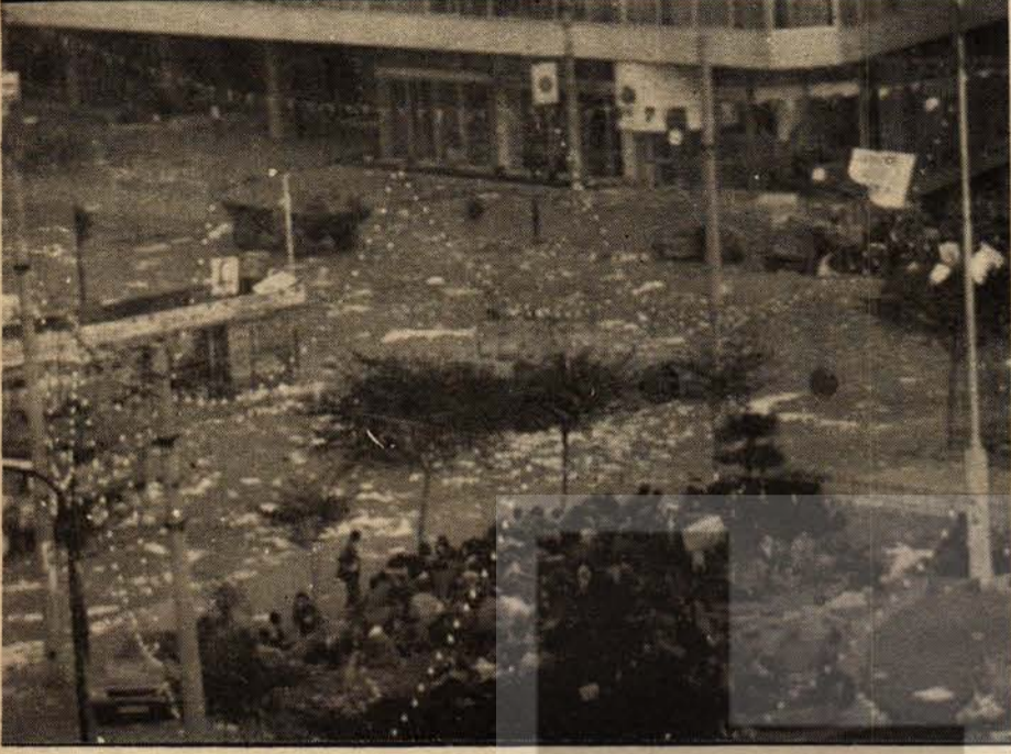
3 Bir panzer Kazancı yokuşunun başındaki halkın üzerine doğru geliyor.