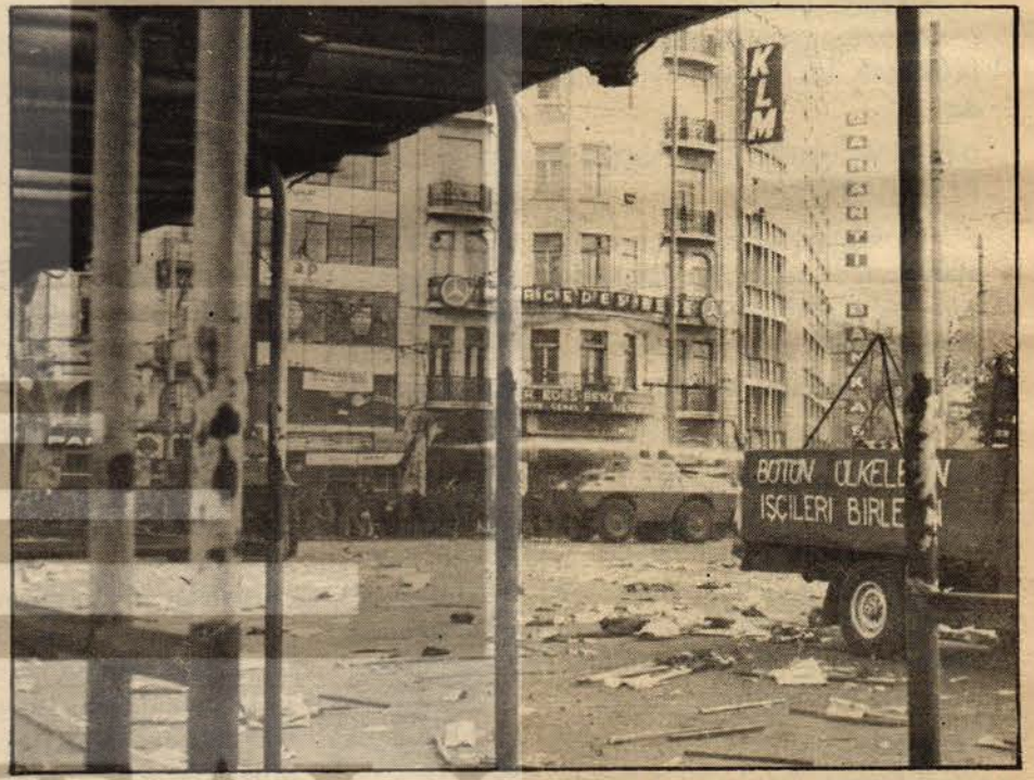
6 Aynı anın başka bir yerden görünümü