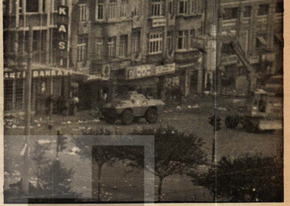
4 Panzer Sıraselviler tarafından yukarıya doğru su sıkıyor.