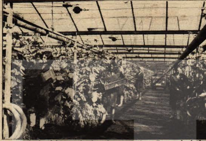
Kırsal alanlardaki seralarda sebze yetiştiren Romen kadınları

Bağımsızlığa kavuşmasının 100'üncü yıldönümünde, Romen halkını en sıcak duygularla kutluyoruz. Sosyalizm inşa yolunda başarılar diliyoruz.