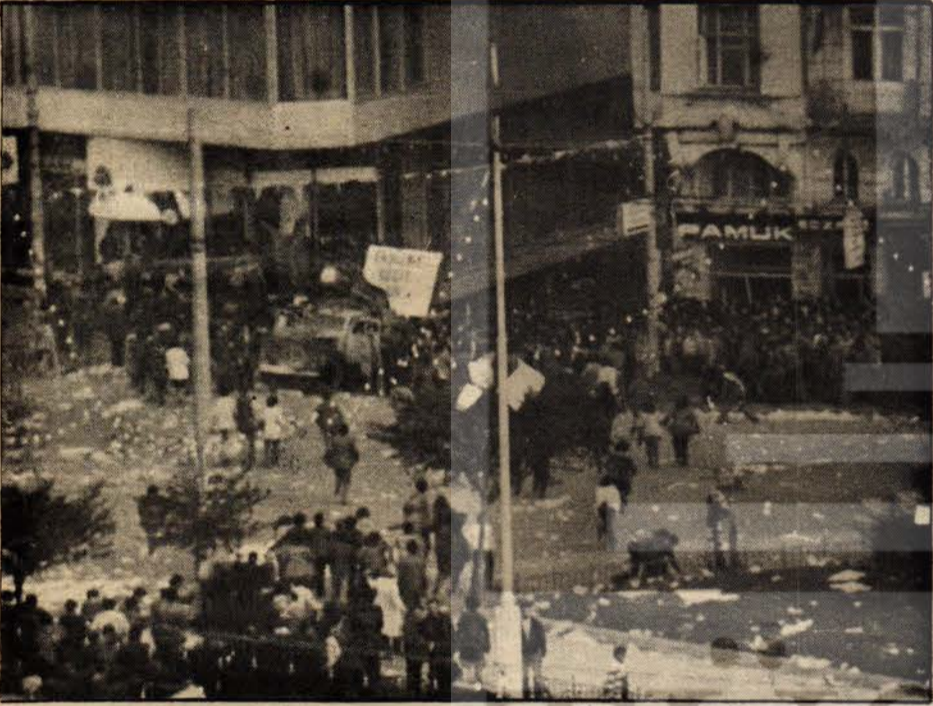
7 Üç panzer. Kazancı Yokuşu'na halkı sıkıştırmış bulunuyor.