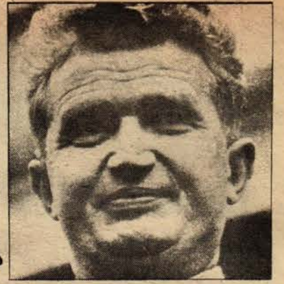
Romanya Devlet Başkanı Nicolai ÇAVUŞESKU

9 Mayıs kardeş Romen halkının ulusal bağımsızlığa kavuşmasının 100'üncü yıldönümüdür. Türkiye halkı Romen halkının bu mutlu gününü en içten dostluk ve kardeşlik duygularıyla selamlıyor.