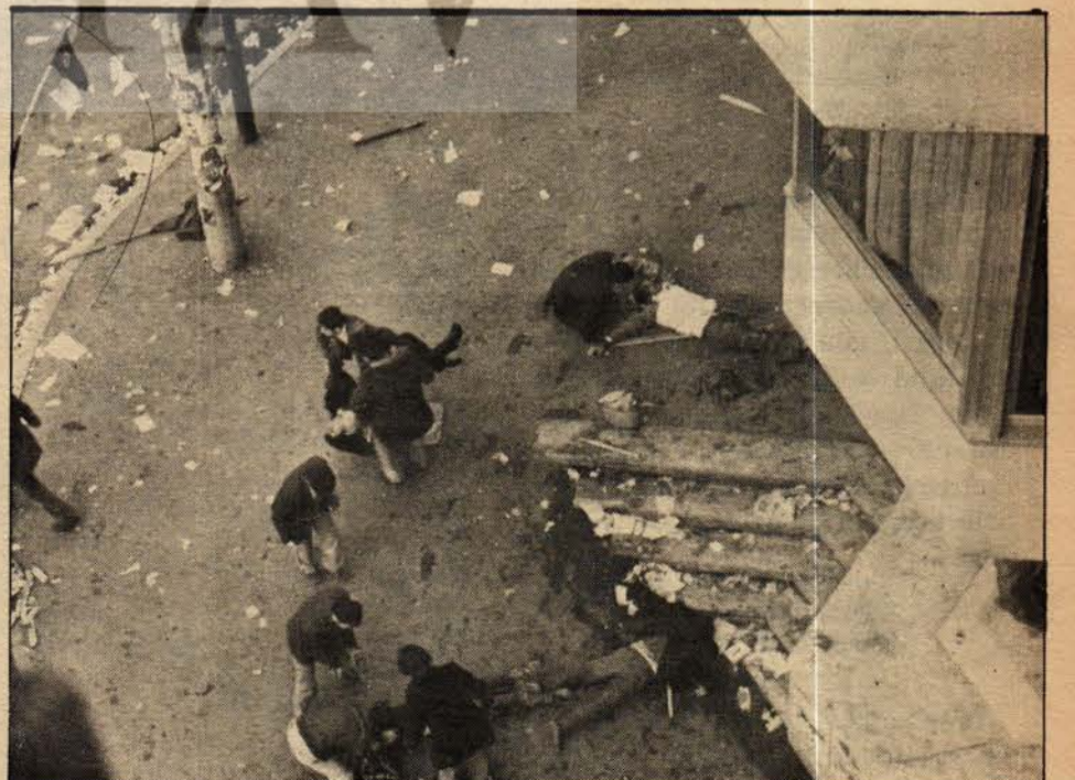
12 Kazancı Yokuşunun önü. Burada da vurulanlar var.