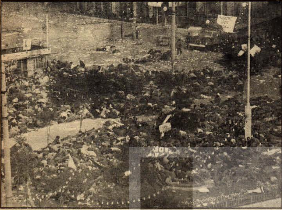
1 İlk taramadan sonraki durum. Kazancı yokuşuna doğru giden halk görünüyor.